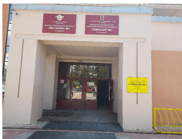
Рисунок 2 – Вывеска на фасаде Гимназии 1 с подписью шрифтом Брайля