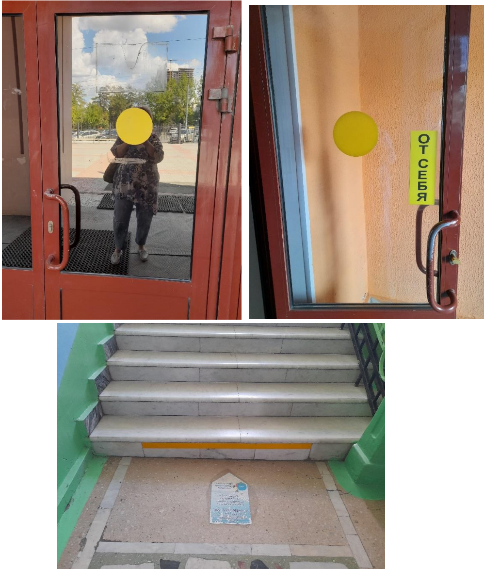
Рисунок 3 – Обозначения для слабовидящих на входной группе, дверях внутренних помещений и лестничном марше в Гимназии 1